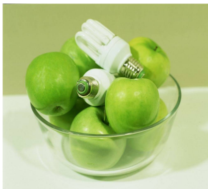
( megaman groene ring spaarlampen )

MEGAMAN® is terecht trots op zijn milieuvriendelijke groene ring spaarlampen.